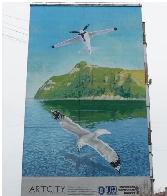
7. Мурал «Сны моего детства»