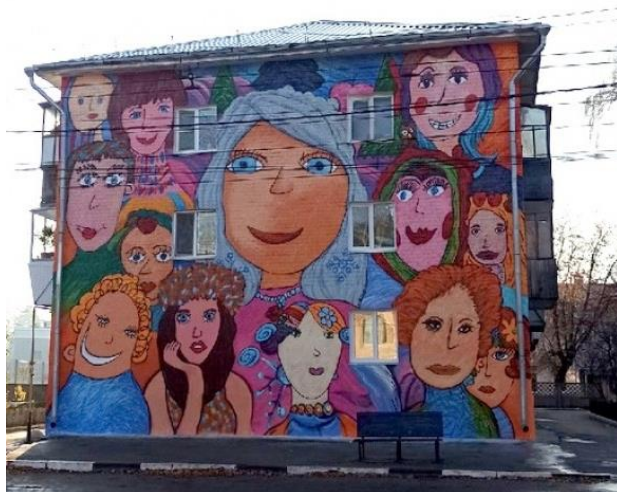
6. Мурал «Отражение»